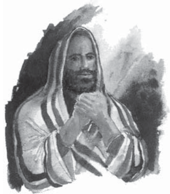
De obicei, Domnul vorbește profeților Săi prin viziuni și vise.