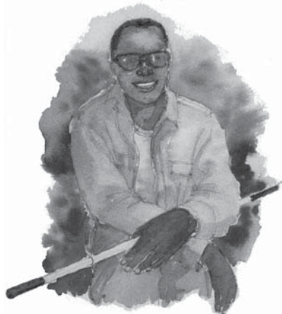
O biserică fără darul profeției este oarbă.

Răspuns: Deoarece un profet este numit uneori văzător, adică cineva care poate privi în viitor, ochii vor reprezenta cel mai bine darul profeției.