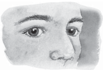
Ochii bisericii simbolizează profeția.

15. În 1Corinteni 12:1-18, apostolul Pavel compară darurile pe care Domnul Isus le-a dat bisericii cu părțile corpului omenesc. Care parte a corpului reprezintă cel mai bine darul profeției?