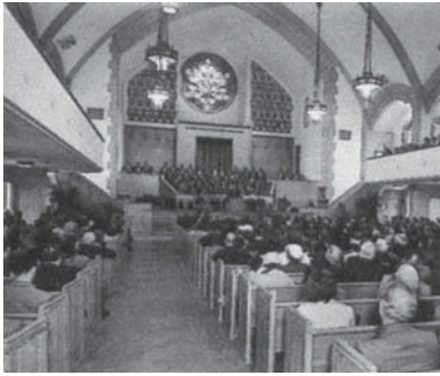
Un profet al Domnului va sluji biserica mai degrabă decât oameni la întâmplare.

12. Lucrarea unui profet adevărat este în primul rând în slujba bisericii sau a celor necredincioși?