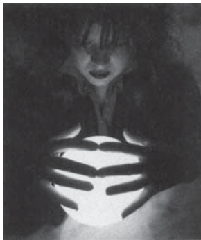
Dumnezeu nu vorbește poporului Său prin globul de cristal.

Notă: Cei mai mulți dintre acești profeti falși pretind că au legătură cu spiritele morților. Biblia spune clar că cei morți nu pot lua legătura cu cei vii. (Vezi studiul, biblic nr. 10). Presupusele spirite ale morților, sunt îngeri răi sau demoni (Apocalipsa 16:13, 14). Globurile de cristal, citirea în palmă, în cafea sau în stele, datul în cărți, în bobi sau cu ghiocul, descântecul, vrăjitoria și comunicarea cu presupusele spirite ale morților, nu sunt căile lui Dumnezeu de comunicare cu oamenii. Sfânta Scriptură învață clar că toți aceia care sunt implicați în asemenea lucruri, sunt o urăciune înaintea Sa (Deuteronom 18:12). Dar și mai rău, aceia care continuă cu aceste practici nu vor intra în Împărăția lui Dumnezeu (Galateni 5:19-21; Apocalipsa 21:8; 22:14, 15).