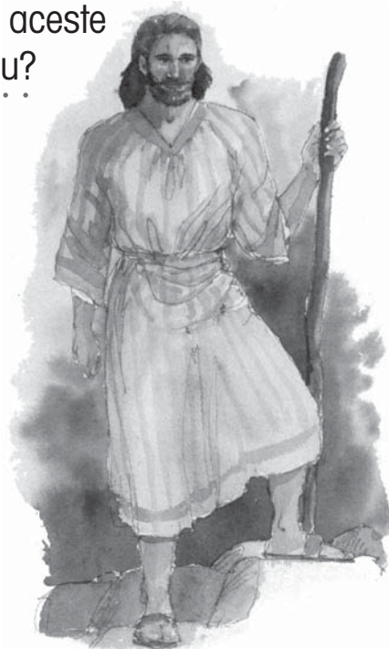
Profeții vorbesc după cum îi inspiră Duhul Sfânt.

Răspuns: Profeții vorbesc în timp ce sunt “mânați de Duhul Sfânt”. În probleme spirituale, ei nu-și exprimă propriile lor opinii. Gândurile lor vin de la Domnul Isus, prin Duhul Sfânt.