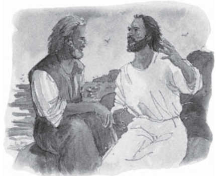
Cuvintele unui profet adevărat sunt un mesaj special de la Isus către poporul Său.

Răspuns: "Mărturia lui Isus", înseamnă că originea cuvintelor profetului vine de la Domnul Isus. Deci, cuvintele unui profet adevărat trebuie considerate ca o solie specială a Domnului Isus pentru noi (Apocalipsa 1:1; Amos 3:7). A aduce reproș asupra unui profet adevărat în vreun fel oarecare, este un lucru extrem de periculos. Este ca și când s-ar aduce reproș asupra Domnului Isus, care trimite și călăuzește pe acești profeți. Nu e de mirare că Dumnezeu avertizează: "Nu faceți rău proorocilor Mei." Psalmul 105:15.