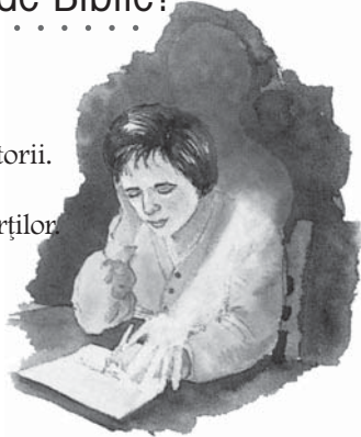
Mediumii și ghicitorii care pretind că vorbesc cu cei morți nu sunt conduși de Dumnezeu.