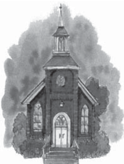
Bisericile care adoptă învățături false de la mama “Babilon” devin Babilon ele însele.

..... Răspuns: Acestea sunt unele din bisericile care la început au protestat împotriva învățăturilor false ale mamei Babilon și pe care au părăsit-o în timpul mării Reformațiuni Protestante. Dar mai târziu, acestea au început să imite principiile și acțiunile mamei lor și astfel au devenit ele însele decăzute. Nici o femeie nu se naște desfrănată. Nici fiicele simbolice, adică bisericile protestante nu s-au născut decăzute. Orice biserică sau organizație care învață și urmează doctrinele și practicile false ale Babilonului, poate deveni o biserică sau o fiică decăzută. Astfel Babilonul este un nume familiar care cuprinde atât biserica mamă cât și pe acelea dintre fiicele ei, care de asemeni sunt decăzute.