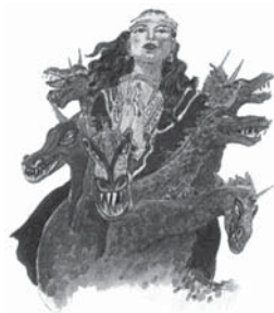
Fiara din Apocalipsa 17 reprezintă puterea civilă. Femeia călare pe fiară înseamnă că biserica conduce statul.

Răspuns: În Apocalipsa 13:1-10, Domnul Isus înfățișează papalitatea ca o combinație a bisericii cu statul. (Pentru mai multe informații, vezi studiul nr. 20). În Apocalipsa capitolul 17, Domnul Isus descrie biserica (femeia desfrânată), și statul (fiara), ca entități separate, totuși asociate. Femeia stând pe spatele unei fiare înseamnă că biserica controlează statul.