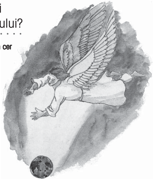
Mesajul lui Dumnezeu din timpul sfârșitului va aduce adevărul glorios și lumină fiecărei persoane de pe pământ.

Răspuns: În Sfintele Scripturi, îngerii reprezintă soli sau solii (Evrei 1:13, 14). Apelul lui Dumnezeu pentru timpul sfârșitului este simbolizat printr-un înger puternic a cărui putere este așa de mare încât întreg pământul este luminat cu adevărul și slava lui Dumnezeu. Această solie finală dată de Dumnezeu va ajunge la locuitorii întregului pământ (Apocalipsa 14:6; Marcu 16:15; Matei 24:14).