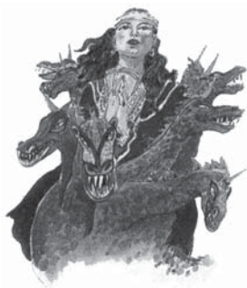
În cartea Apocalipsa, Dumnezeu denumește această femeie "Babilon."