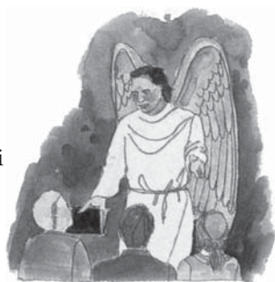
În timpul sfârșitului, Satana va amăgi pe toți aceia care nu cer o dovadă clară din Scriptură pentru orice doctrină biblică.

Răspuns: Deși Satana urăște pe Dumnezeu și pe Fiul Său, el rar admite aceasta în mod deschis. De fapt, el și demonii lui se vor înfățișa ca îngeri sfinți și ca slujitori creștini devotați (2Corinteni 11:13-15). Ceea ce prezintă ca dovadă de partea lui, va părea așa de neprihănit, de spiritual și asemănător cu Domnul Isus, încât aproape orice om de pe pământ va fi înșelat și-l va urma (Matei 24:24). Fără îndoială, el va folosi Biblia, așa cum a făcut când a ispitit pe Isus în pustie (Matei 4:1, 11). Logica lui Satana este așa de convingătoare, că a înșelat a treia parte din îngerii cerului, a înșelat pe Adam și Eva, iar în timpul potopului pe toți oamenii de pe pământ, cu excepția a opt suflete.