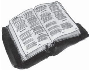
Cuvântul lui Dumnezeu descoperă strategia lui Satana.