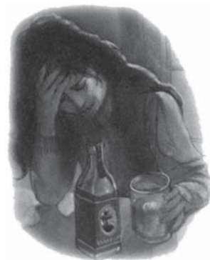
Primirea învățăturilor false produce beție spirituală, care face foarte dificilă înțelegerea adevărului.

Botezul prin scufundarea în apă este singurul botez recunoscut de Biblie (vezi studiul biblic nr. 9).