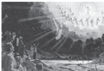
Înșerii din ceruri vor fi de partea copiilor lui Dumnezeu în lupta finală.

Răspuns: În această luptă finală, îngerii din ceruri (Evrei 1:13, 14; Matei 13:41, 42), și poporul lui Dumnezeu – rămășița – se vor alia cu Domnul Isus, care conduce oștile cerești, împotriva lui Satana și a aliaților lui (Apocalipsa 12:17; 19:11-16).