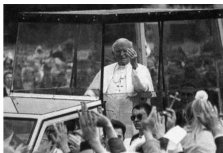
Papalitatea este cea mai mare putere politico-religioasă de pe pământ.

F. Gorbaciov a spus: “Tot ceea ce a avut loc în Europa de Răsărit în ultimii ani, ar fi fost imposibil de realizat fără rolul enorm și eforturile papei, inclusiv rolul politic pe care el l-a jucat pe arena mondială.” – Mikhail Gorbachev, Toronto Star, 9 martie 1992.