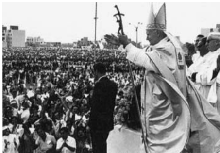
Papa este cel mai popular conducător al lumii.

D. Reacția internațională a fost aproape copleșitoare. În timpul crizei din Irak, papa și președintele Americii, adesea discutau săptămânal la telefon problemele lumii. – U. S. News and World Report, 13 august 1990, p. 18.