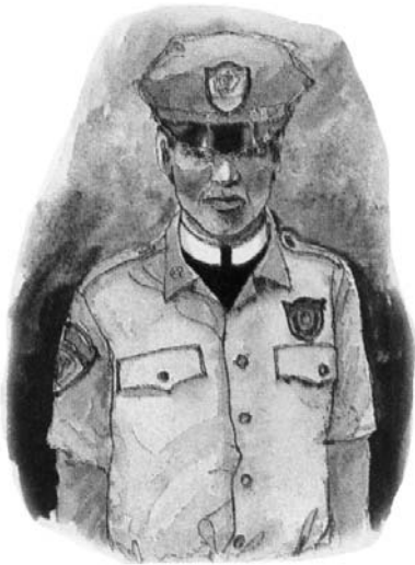
În anul 1798 generalul Berthier a produs o rană de moarte papalității când a luat pe papa prizonier.