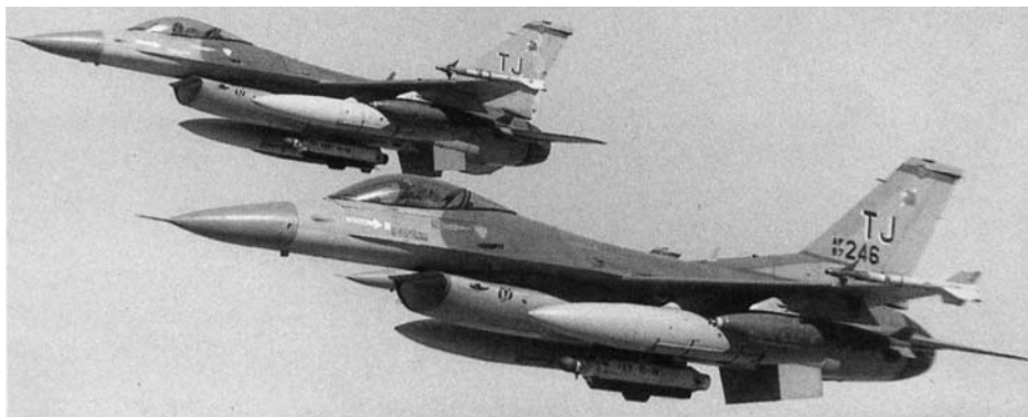
Toate națiunile pământului privesc acum la SUA pentru protecție și ajutor.

Când un grup marxist a răsturnat guvernul Etiopiei, America a fost rugată să negocieze. Când Boris Yeltsin a luat funcția de președinte al Rusiei recent independentă, el a vizitat în primul rând America. Fostul președinte al U.R.S.S. Mihail Gorbaciov s-a îndreptat către America în criza prin care a trecut. Când Kuveitul a fost invadat, guvernul lui a chemat America. Războiul împotriva Irakului condus de Statele Unite a avut sprijinul aproape al întregii lumi. Un corespondent al postului de radio național l-a numit pe președintele american, “președintele lumii.” Noi avem acum “o înaltă și neobișnuită structură mondială cu o singură putere, Statele Unite, în vârful sistemului internațional.” - Krauthammer, The New Republic, p. 23.