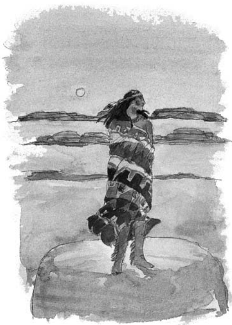
Profeția a prezis că America se va ridica într-o zonă slab populată.