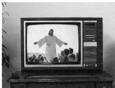
Ca o încununare a minunilor, Satana va personifica pe Isus.

Îngerii lui Satana vor apărea ca slujitori bisericești evlavioși, iar Satana ca înger de lumină (2Corinteni 11:13-15). Ca o încoronare a minunilor sale, el va pretinde că este Isus (Matei 24:23,24). În timp ce va personifica pe Domnul Hristos, Satana va pretinde cu ușurință că el a schimbat Sabatul la duminică și va îndemna pe urmașii lui să continue redeșteptarea mondială și să înalțe ziua sa “sfântă” – duminica.