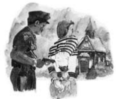
La vremea sfârșitului, America va constrânge pe oameni sau să se închine sau să fie pedepsiți.

Răspuns: Așa cum am învățat în studiul biblic nr. 20, balaurul este Satana, care lucrează prin intermediul diferitelor forme de guvernământ ale lumii, să-și stabilească împărăția sa primejdioasă și să zdrobească biserica lui Dumnezeu prin persecutarea și nimicirea poporului Său. Ținta lui Satana a fost întotdeauna să uzurpe puterea și tronul lui Dumnezeu și să forțeze pe oameni să i se închine și să asculte de el. (pentru detalii vezi studiul biblic nr. 2.) Astfel expresia “vorbea ca un balaur”, înseamnă că Statele Unite (sub influența lui Satana), în timpul sfârșitului, vor forța pe oameni să se închine împotriva conștiinței lor sau dacă nu, să fie pedepsiți.