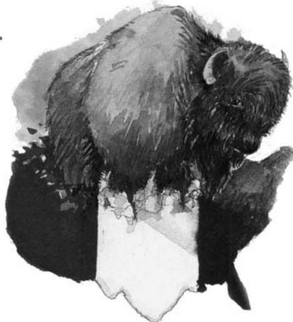
Fiara din Apocalipsa 13:11-18 simbolizează America.

Răspuns: Captivitatea papală menționată în versetul 10 a avut loc în anul 1798, iar puterea cea nouă (versetul 11) a fost văzută ridicându-se în vremea aceea. Statele Unite și-au declarat independența în anul 1776, a votat Constituția în anul 1787, a adoptat Carta Drepturilor omului în anul 1791 și a fost recunoscută ca putere mondială în anul 1798. Datarea se potrivește foarte bine pentru America. Nici o altă putere nu poate corespunde.