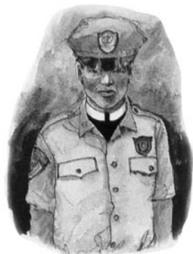
Religia apostaziată și guvernarea civilă se vor uni în timpul sfârșitului pentru a forța conștiința oamenilor.

Răspuns: Să observăm cele patru caracteristici importante: