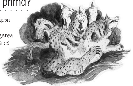
Fiara din Apocalipsa 13:1-10 simbolizează papalitatea.

Răspuns: Fiara cu șapte capete (Apocalipsa 13:1-10) nu este alta decât papalitatea romană. (Vezi studiul 15 pentru înțelegerea completă a acestui subiect). Amintiți-vă că fiarele în profetia biblică simbolizează popoare sau puteri mondiale. (Daniel 7:17,23)