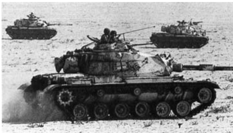
America este puterea militară numărul 1 in lume.

D. “Puterea Americii va hotărî acum asupra tuturor evenimentelor globale majore.” Jim Hoagland, “Of Heroes...,” The Washington Post, 21 august, 1991, p. A-23.