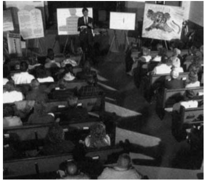
În ultimele zile ale pământului, solia lui Dumnezeu de speranță va ajunge la fiecare om.

14. Ce se va întâmpla cu redeşeptarea mondială adevărată inițiată de poporul lui Dumnezeu din timpul sfârșitului, în timp ce crește interesul în redeşeptarea falsă?