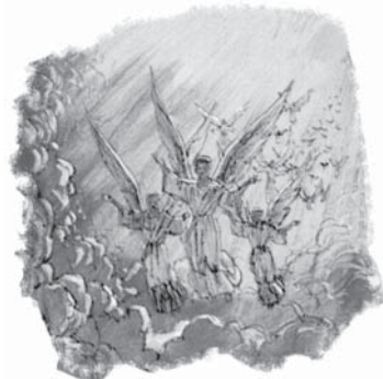
Toți îngerii din ceruri vor fi cu Isus la a doua Sa venire

Răspuns: Toți îngerii din ceruri vor veni împreună cu Domnul Isus la a doua Sa venire. În timp ce norul se apropie de pământ, Domnul Isus va trimite pe îngerii Săi și vor strânge repede pe toți cei drepecți care sunt pregătiți pentru călătoria de întoarcere către ceruri (Matei 24:31). Slava Tatălui va însoți pe Isus la a doua Sa venire pe pământ (Luca 9:26).