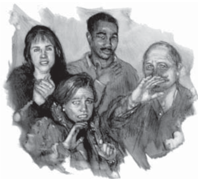
Fiecare om va vedea pe Isus revenind.

Răspuns: Orice bărbat, femeie și copil care va trăi pe pământ când Isus va veni, Îl va vedea la a doua Sa venire. Strălucirea venirii Sale se va întinde de la răsărit la apus și firmamentul va fi plin de gloria orbitoare a măririi Sale (Luca 9:26). Nimeni nu se va putea ascunde. Orice suflet viu va fi obligat să stea în fața Domnului Isus. El nu a lăsat nici o porțiță pentru îndoială și înțelegere greșită.