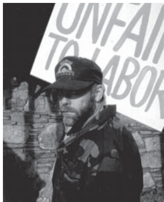
Disputele între patroni și angajați sunt un semn al revenirii lui Isus.

Secolul 20 a fost cel mai sângeros și mai revoluționar din istorie. Și pregătirile de război devin zilnic mai delirante. Un semn al timpului din urmă.