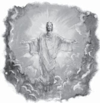
Isus a spus că va reveni pe norii cerului.

Răspuns: Sfânta Scriptură făgăduiește că Domnul Isus Se va reîntoarce pe pământ în același fel cum S-a înălțat la cer într-o formă vizibilă, literală și corporală. În Matei 24:30 se spune: „...și vor vedea pe Fiul omului venind pe norii cerului cu putere și cu o mare slavă”. El va veni pe nori în mod literal, ca o ființă personală cu trup în carne și oase (vezi Luca 24:36-43, 50, 51) și venirea Sa va fi vizibilă. Scriptura este precisă cu privire la aceste realități.