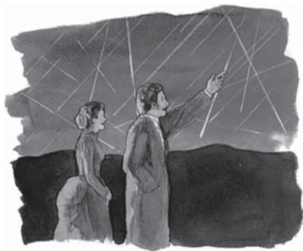
Marea cădere de stele a avut loc pe 13 noiembrie 1833.

Așa de strălucitoare a fost acea noapte încât un ziar putea fi citit pe stradă. Oamenii credeau că a venit Sfârșitul lumii. Puteți cerceta acest lucru. A fost cel mai fascinant semn al revenirii Domnului Hristos.