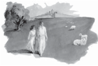
Isus va lua pe copiii Săi în cer și va recrea tot ce Adam și Eva au pierdut.

Răspuns: Domnul Isus vine din nou pe acest pământ, ca să răsplătească pe copiii Săi așa cum a făgăduit și să-i ducă în frumoasele locuințe pe care El le-a pregătit pentru ei. El va recrea pentru poporul Său toate bucuriile și splendorile Edenului pe care Adam și Eva le-au pierdut prin păcat. A doua Sa venire va aduce sfârșitul acestui veac al răutății.