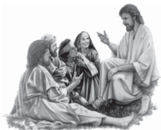
Isus a spus că va reveni pe pământ a doua oară.