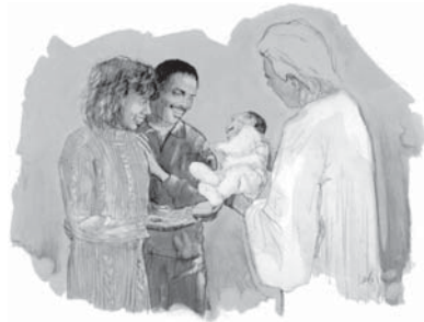
Copilașii pierduți prin moarte vor fi readuși părinților la a doua venire a lui Isus.