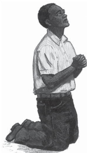
Dumnezeu îmi va ierta orice păcat pe care l-am mărturisesc.

Răspuns: Când Duhul Sfânt mă convinge de păcat, eu trebuie să-mi mărturisesc păcatele pentru a fi iertat. Când le mărturisesc, Dumnezeu nu numai că mă iartă, dar El în mod miraculos mă curățește de toată nelegiuirea mea. Dumnezeu așteaptă și este gata să mă ierte de orice păcat pe care-l săvârșesc, dar numai dacă îl mărturisesc și-l părăsesc. (Psalmii 86:5).