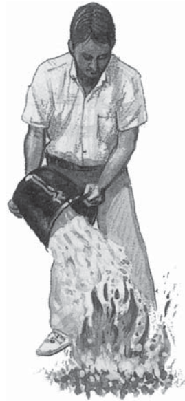
Păcatul este ca apa. Continuarea în păcat stinge focul Duhului Sfânt.

Orice păcat nemărturisit și nepărăsit poate în cele din urmă să stingă focul Duhului Sfânt. Acest păcat poate fi refuzul de a păzi Sabatul zilei a șaptea ca zi sfântă a Domnului sau folosirea tutunului sau faptul de a nu ierta pe cineva care te-a înșelat sau te-a rănit. Acest păcat poate fi imoralitatea sau reținerea zecimii Domnului. Refuzul de a asculta de glasul Duhului Sfânt în orice domeniu, toarnă apă pe focul Duhului Sfânt. Nu stinge focul. Nu poate fi o tragedie mai mare.