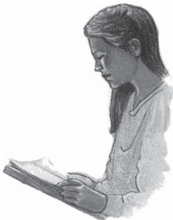
Duhul Sfânt conduce pe oameni la adevărul Bibliei.

Răspuns: Lucrarea Duhului Sfânt este să mă convingă de păcat și să mă călăuzească în tot adevărul. Duhul Sfânt este Agentul lui Dumnezeu pentru convertire. Fără Duhul Sfânt, nimeni nu simte părere de rău pentru păcat și nici nu poate să se convertească vreodată.