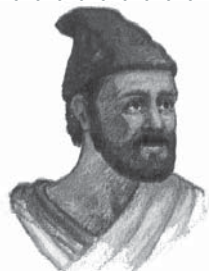
Adevărul prezent al lui Ioan Botezătorul era Mesia care urma să se se arate

(Apocalipsa 14:6-14). “Adevărul prezent” al lui Dumnezeu pentru astăzi, este cuprins în întreita solie îngerească. Bineînțeles, esența mesajului este mântuirea numai prin Isus. Totuși, “adevărul prezent” al celor trei îngeri, este propovăduit pentru a pregăti omenirea în vederea revenirii lui Isus și pentru a-i avertiza împotriva amăgirilor iscusite și atât de eficiente ale lui Satana. Dacă oamenii nu înțeleg acest mesaj, vor fi înșelați și distruși de Satana. Isus știa că noi avem nevoie de aceste solii, așa că El ni le-a dăruit în bunătața Sa plină de iubire. Te rog, stăruiește în rugăciune în timp ce studiezi, punct cu punct, următoarele opt broșuri. S-ar putea să fii șocat de anumite descoperiri pe care le vei face. Dar vei fi pe deplin mulțumit. Inima ta va fi adânc impresionată. Îl vei auzi pe Isus vorbindu-ți. La urma urmei, este mesajul Lui.