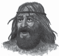
Adevărul prezent al lui Iona era distrugerea Ninivei.

B. Mesajul lui Iona , cu privire la Ninive (Iona 3:4). “Adevărul prezent” al lui Iona era că cetatea Ninive avea să fie distrusă în 40 de zile. Iona L-a înălțat pe Isus și toată cetatea s-a pocăit. Totuși, dacă ar fi neglijat solia, locuitorii cetății nu ar fi fost iertați.