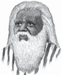
Adevărul prezent al lui Noe era potopul

A. Mesajul lui Noe, referitor la potop (Geneza 6 și 7: 2 Petru 2:5). Noe a fost un predicator al neprihănirii. El a învățat pe oameni despre dragostea lui Dumnezeu și i-a avertizat cu privire la potopul care avea