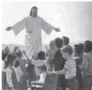
În mod special, Apocalipsa descoperă pe Isus.

Notă: Înainte de a trece mai departe, te rog, citește Apocalipsa 14:6-14.