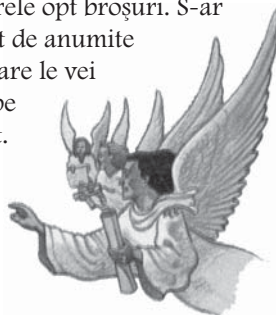
Soliile celor trei îngeri sunt adevărul prezent al Dumnezeu pentru astăzi.