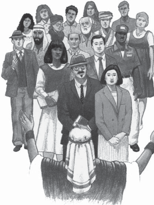
Solia lui Dumnezeu din timpul sfârșitului, este numită solia lui "Ilie", pentru că va obliga pe oameni să ia o hotărâre.

Răspuns: Profetul Ilie. Așa cum vom vedea în următoarele câteva întrebări, există un aspect semnificativ despre Ilie și mesajul său.