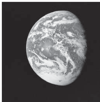
Mesajul de speranță al lui Dumnezeu trebuie să fie adresat fiecărui suflet de pe pământ.

Două dintre cele mai eficiente amăgiri ale lui Satana sunt: (1) mântuirea prin fapte și (2) mântuirea în păcat. Aceste înșelăciuni sunt demascate în întreita solie îngerească. Poate fără voia lor, mulți oameni au îmbrățișat una din aceste erezii, pe care încearcă să-și clădească mântuirea - ceea ce este absolut imposibil. De asemenea, trebuie să accentuăm faptul că nimeni nu predică cu adevărat Evanghelia lui Isus, dacă nu include și întreita solie îngerească.