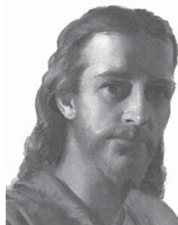
Întreită solie îngerească se concentrează asupra lui Isus.