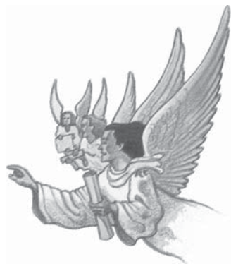
Dumnezeu folosește îngerii pentru a simboliza desfășurarea întreitei solii.

2. Dumnezeu a însărcinat biserica Să, să ducă Evanghelia la orice făptură (Marcu 16:15). Cum este simbolizată în Apocalipsa, această sfântă lucrare?