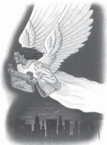
Poporul lui Dumnezeu trebuie să iasă din Babilon.

..... "Apoi a urmat un alt înger, al doilea, și a zis: "A căzut, a căzut Babilonul..." Apocalipsa 14:8 "După aceea, am văzut coborându-se din cer un alt înger... El a strigat cu glas tare, și a zis: "A căzut, a căzut Babilonul cel mare!... Apoi am auzit din cer un alt glas, care zicea: "Yeșiți din mijlocul ei, poporul Meu..." Apocalipsa 18:1-4