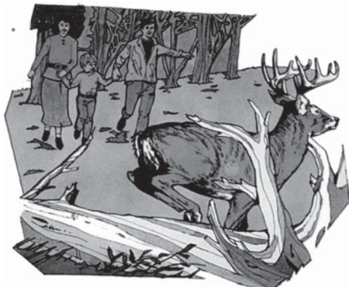
Exercițiul în natură ne va ajuta în pregătirea pentru ceruri.

..... "Nimic întinat nu va intra în ea, nimic care trăiește în spurcăciune..." Apocalipsa 21:27. "Dar acelor a căror inimă simte plăcere față de idolii și urâciunile lor, le voi întoarce faptele asupra capului lor, zice Domnul Dumnezeu." Ezechiel 11:21.