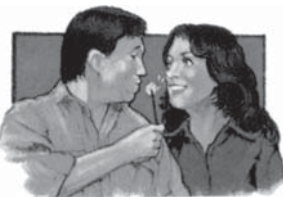
Buna dispoziție ajută sănătății.

“O inimă veselă este un bun leac...” Proverbele 17:22.