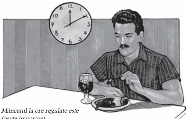
Măncatul la ore regulate este foarte important.