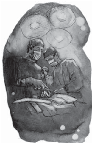
Nerespectarea legilor sănătății date de Dumnezeu duce pe mulți pe masa chirurgului.

Răspuns: Răspunsul este prea clar ca să nu fie înțeles. Aceia care calcă principiile lui Dumnezeu cu privire la îngrijirea mașinării corpului omenesc vor secera o sănătate subredă și o viață ce sfârșește înainte de vreme, la fel cum cineva prin folosirea abuzivă a automobilului său va avea necazuri cu acesta. Și aceia care continuă să calce legile sănătății lăsate de Dumnezeu, în final vor fi distruși de El (1 Corinteni 3:16, 17). Aceste legi nu sunt arbitrare, ci sunt legile Universului, stabilite în mod natural, la fel cum este și legea gravitației. Ignorarea acestor legi, întotdeauna și în mod sigur aduce rezultate dezastruoase. Biblia spune că blestemul (răul) nu vine "neintemeiat", adică fără cauză (Proverbele 26:2), ci necazurile vin atunci când noi ignorăm aceste legi. Dumnezeu, în mila Sa, ne spune care sunt aceste legi, ca în felul acesta să putem evita tragediile care rezultă din călcarea lor.