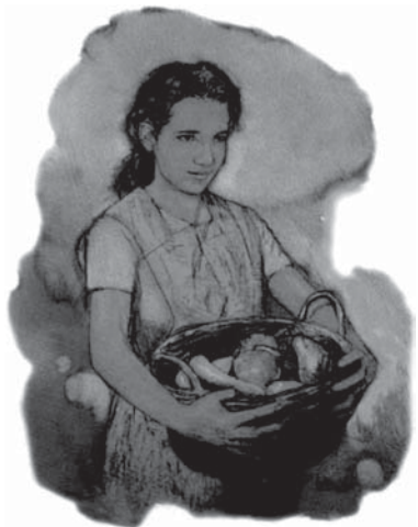
Creștinii sinceri și iubitori vor dori să aducă viețile lor în armonie cu legile divine ale sănătății.

..... "...să ne curățim de orice întinăciune a cărnii..." 2 Corinteni 7:1. "Oricine are nădejdea aceasta în El, se curățește, după cum El este curat." 1 Ioan 3:3. "Dacă Mă iubiți, veți păzi poruncile Mele." Ioan 14:15.