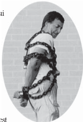
Obiceiurile rele care ne leagă, pot să ne despartă repede de Isus.

Răspuns: Ia toate aceste lucruri și depune-le la picioarele Domnului Hristos. El îți va da o inimă nouă și îți va dărui fără plată, puterea necesară de a învinge orice obicei rău și să poți deveni un copil al lui Dumnezeu (Ezechiel 11:18, 19). Cât de minunat și emoționant este să știi că la Dumnezeu “toate lucrurile sunt cu putință”. Marcu 10:37. Iar Isus spune: “pe cel ce vine la Mine, nu-l voi izgoni afară.” Ioan 6:37. Domnul Isus dorește să rupă cătușele care ne leagă și să ne libereze, dacă Îi vom permite acest lucru. Atunci când rămănem în Domnul Hristos, toate îngrijorările, obiceiurile rele, stările de tensiune nervoasă și temerile noastre, vor dispărea. “V-am spus aceste lucruri, pentru ca... bucuria voastră să fie deplină.” Ioan 15:11. Diavolul neagă acest lucru și învață că libertatea se află în neascultare, dar aceasta este o înșelăciune (Ioan 8:44).