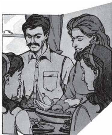
Legile sănătății lăsate de Dumnezeu ne spun multe despre ce trebuie să mâncăm și să bem

„...veți mânca ce este bun...” Isaia 55:2. „Deci, fie că mâncați, fie că beți, fie că faceți altceva: să faceți totul pentru slava lui Dumnezeu.” 1 Corinteni 10:31.