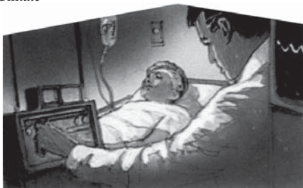
O persoană poate să sufere din cauza unui stil de viață greșit al părinților și al bunicilor săi.

Răspuns: Dumnezeu arată foarte clar faptul că, atât copiii cât și nepoții până la a patra generație, au de suferit din cauza nebuniei părinților lor, care ignoră legile sănătății stabilite de Dumnezeu. Copiii și nepoții moștenesc un organism slăbit și bolnăvicios deoarece mama și tata sfidează legile lăsate de Dumnezeu pentru viața lor. Dorești tu așa ceva pentru scumpii tăi copii și nepoți?