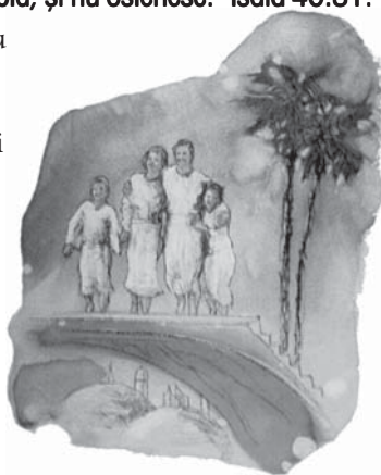
În cer nu va fi boală și suferință. Toți locuitorii vor urma legea de viață a lui Dumnezeu.