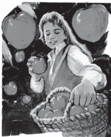
Pentru Adam și Eva, Dumnezeu a prescris o dietă vegetariană

Notă: Nimeni nu va intra în ceruri, mâncând după voia sa și nici mâncând hrana îngerilor, nu va califica pe cineva să intre în Paradis. Numai acceptarea lui Isus ca Domn și Mântuitor poate face acest lucru. Cu toate acestea mâncarea nerațională poate cauza pierderea acelei persoane, deoarece acest lucru îi va ruina judecata sănătoasă și o va determina să păcătuiască.