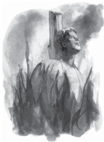
Milioane de creștini și-au pierdut viața de-a lungul perioadei de persecuție papală.

De asemenea, punctele H și J corespund într-un total papalității. Ne-am referit la ele foarte pe scurt deoarece punctele E,G și H de la întrebarea 8 a studiului 15 acoperă în întregime subiectele respective.