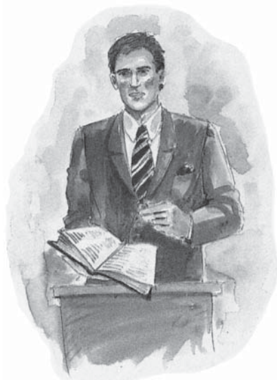
Conducătorii religioși care nesocotesc Sabatul sfânt al lui Dumnezeu vor înfrunta mânia Sa.