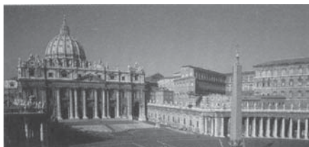
Papalitatea este Antichristul.

Cele patru fiare din Daniel 7 sunt descrise ca părți ale Antichristului sau ale fiarei, pentru că papalitatea însumează credințele păgâne și practicile religioase ale celor patru imperii. Papalitatea a dat acestor credințe și practici o înfățișare spirituală și le-a răspândit în lume ca învățături creștine. Iată una dintre cele mai elocvente declarații istorice, în acest sens: “În anumite privințe, [papalitatea] a copiat structura organizatorică a Imperiului Roman, a păstrat și dezvoltat