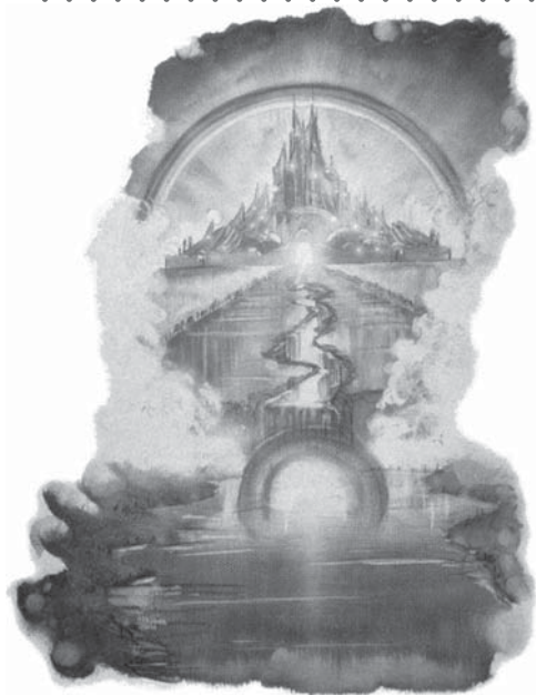
În cer vor intra numai cei care au pe frunte semnul sau sigiliul lui Dumnezeu.

Răspuns: Răspunsul este întreit și foarte clar: