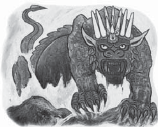
Fiara din Apocalipsa 13 simbolizează Antichristul.

Nu cumva aceste caracteristici vă sunt cunoscute deja? Desigur! Am întâlnit multe dintre ele atunci când am studiat despre Antichrist, în Daniel capitolul 7. “Fiara” din Apocalipsa 13, de fapt, este un alt nume dat Antichristului, care după cum am învățat din Daniel capitolul 7, este papalitatea. Deseori, profețiile din Daniel și Apocalipsa se referă la același subiect, completându-se reciproc cu aspecte importante care aduc siguranță și credibilitate. Așadar, în acest studiu te poți aștepta la noutăți cu privire la Antichrist. Să supunem atenției, unul câte unul, cele 11 caracteristici care descriu fiara.