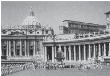
Peste 100 de națiuni au reprezentanțe diplomatice la Vatican

De la vindecarea răni, puterea papalității a crescut și s-a dezvoltat până astăzi. Ea este una dintre cele mai puternice organizații politico-religioase și centre de influență din lume. Malachi Martin, un expert inteligent care cunoaște în profunzime Vaticanul, descoperă următoarele, într-una dintre cele mai vândute cărți ale sale: The Keys of This Blood (paranteza indică numărul paginii):