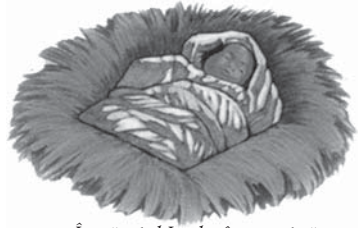
Împăratul Irod a încercat să “înghită”, sau să ucidă pe Isus la nașterea Sa.

Pentru a identifica balaurul, mergem în capitolul 12 din Apocalipsa unde biserica lui Dumnezeu din timpul sfârșitului este simbolizată printr-o femeie neprihănită. În profeție, o femeie neprihănită reprezintă poporul sau biserica lui Dumnezeu (Ieremia 6:2; Isaia 51:16). (În broșura 23 vom prezenta un studiu amănunțit referitor la biserica lui Dumnezeu din timpul sfârșitului, descrisă în capitolul 12 din Apocalipsa. Studiul 22 explică capitolele 17 și 18, în care bisericile apostaziate sunt simbolizate de o mamă decăzută și de fiicele ei apostaziate.) Femeia neprihănită este însărcinată și gata să nască, Balaurul stă la pândă în apropiere, sperând să “mănânce” copilul, când se va naște. Totuși, la naștere copilul scapă de balaur, Își împlinește misiunea apoi se înalță la cer. Evident copilul pe care Irod a încercat să-L nimicească, ucigând toți pruncii din Betleem, este Isus (Matei 2:16). Balaurul reprezintă Roma păgână, al cărei împărat era Irod. Desigur, puterea din spatele complotului lui Irod era diavolul (Apocalipsa 12:7-9). Satana acționează prin diferite stăpâniri pentru a-și împlini lucrarea lui nelegiuită - în cazul acesta, Roma păgână. Deși există multe referințe istorice, în sprijinul acestui adevăr, vom cita numai două: (1) “Biserica Romană...s-a autoinstalat în locul Imperiului Roman și reprezintă în prezent