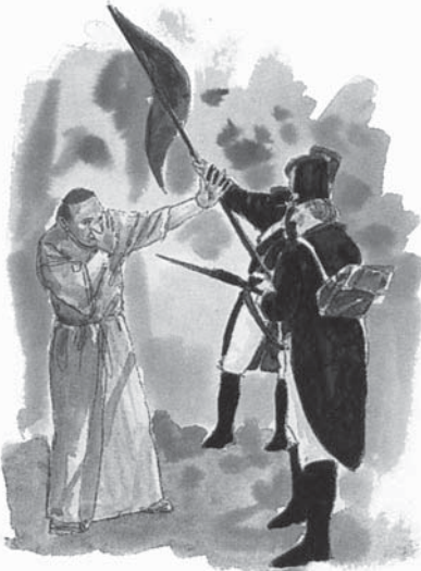
Generalul Berthier a pricinuit rana de moarte papalității, luându-l prizonier pe papa Pius al VI lea.

continuarea sa... Papa este...succesorul Împăraților romani.” (2) Puternica Biserică Romană a fost ceva mai mult decât Imperiul Roman botezat. Ea a fost transformată și convertită în aceeași măsură. Capitala vechiului Imperiu a devenit capitala Imperiului creștin. Îndatoririle lui Pontifex Maximus și-au găsit continuarea în îndatoririle papei.” De asemenea, acest punct se potrivește papalității. Ea a primit puterea și scaunul de domnie de la Roma păgână.