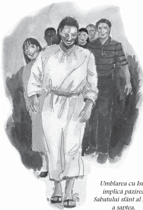
Umblarea cu Isus implică păzirea Sabatului sfânt al zilei a șaptea.

Poate că te întrebi care sunt bisericile protestante care au declarații referitoare la pretenția papalității de a înlocui sâmbăta cu duminica. Citatele menționate pe pagina următoare vor prezenta răspunsuri extraordinare.