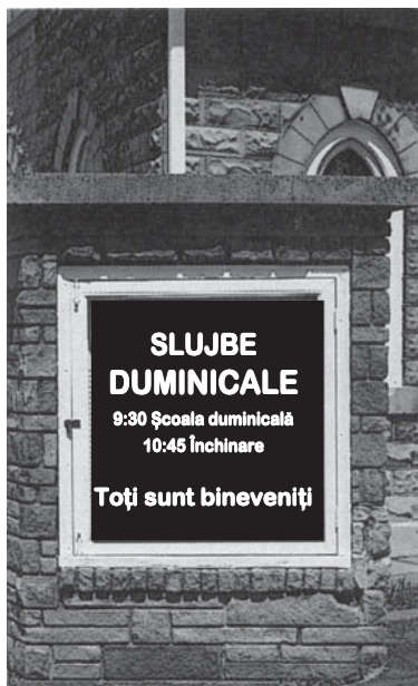
Duminica, ca zi sfântă, este pecetea sau semnul autorității fiarei.

Deci, papalitatea spune că a schimbat sămbăta cu duminica și că toate bisericile au acceptat efectiv această nouă zi sfântă. Astfel, papalitatea pretinde că duminica, ca zi sfântă, este pecetea sau semnul puterii și autorității ei.