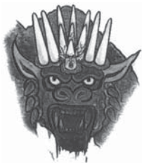
Apocalipsa 13 stabilește 11 caracteristici ale fiarei.

Răspuns: Apocalipsa 13:1-8, 16-18 stabilește 11 caracteristici de identificare, care sunt enumerate mai jos: