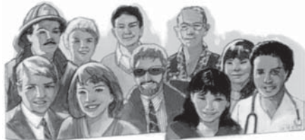
Dumnezeu te cunoaște și are grijă de tine personal.

„Tu ești Dumnezeu care mă vezi!” Genesa 16:13. „Doamne, Tu mă cercetezi de aproape și mă cunoști, știi când stau jos și când mă scol, și de departe îmi pătrunzi gândul. Știi când umblu și când mă culc, și cunoști toate căile mele. Căci nu-mi ajunge cuvântul pe limbă, și Tu, Doamne, îl și cunoști în totul.” Psalm 139:1-4. „Și chiar perii din cap, toți vă sunt numărați.” Luca 12:7.