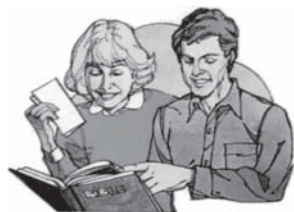
Cercetați Scripturile pentru a afla voia lui Dumnezeu. Este unica siguranță.

Răspuns: Nu! Sfintele Scripturi sunt foarte clare în această privință. Salvarea și Împărăția cerurilor sunt pentru aceia care ascultă de poruncile lui Dumnezeu. Mântuitorul nu poate făgădui viața veșnică acelor care fac doar o mărturisire de credință, că sunt membrii unei biserici, sau sunt botezați, ci mai degrabă acelor care fac voia Sa, descoperită în Sfintele Scripturi. Desigur, această ascultare este posibilă numai prin Domnul Hristos (Faptele Apostolilor 4:12).