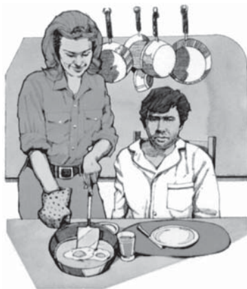
Un cămin curat și ordonat este ferit de multe probleme.

Notă: Lenea, dezordinea, murdăria și ținuta neîngrijită sunt armele diavolului de a distruge respectul și afecțiunea unuia pentru celălalt și desigur acest lucru va ruina căminul vostru. Îmbrăcămintea curată și modestă precum și corpul bine îngrijit sunt esențiale pentru amândoi soții. Servirea meselor trebuie să fie atractivă, sănătoasă și la timp. Casa trebuie să fie curată și ordonată, deoarece aceasta aduce pace, liniște și satisfacție tuturor. Un soț leneș și lipsit de inițiativă, care nu asigură nimic pentru familie este un blestem pentru căminul lui și o insultă pentru Dumnezeu. Nepăsarea în unele din aceste lucruri care par mărunte va duce la distrugerea a mii de căsnicii.