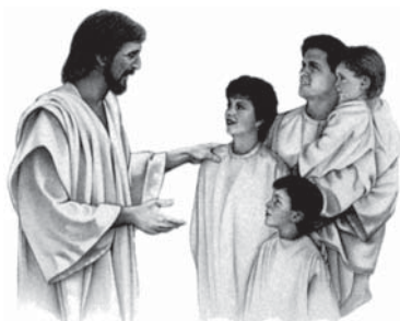
În noul regat, Însuși Domnul va trăi alături de poporul Său.

Răspuns: Dumnezeu va distruge cu foc păcatul și pe toți cei păcătoși. Focul va mistui pământul și va transforma totul în cenușă. Apoi Dumnezeu va face un pământ nou, desăvârșit, iar orașul cel sfânt va fi capitala lui. Aici cei drepecți vor locui în pace, bucurie și sfințenie pentru veșnicie. Dumnezeu făgăduiește că păcatul nu va mai apărea niciodată. Citește Naum 1:9. (Pentru informații privind “Iadul”, citește broșura Nr. 2.)