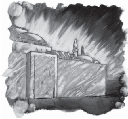
Dumnezeu este Arhitectul și Constructorul acestui oraș sfânt