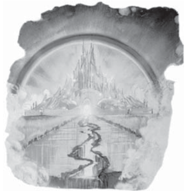
Acest oraș uimitor se află în Cer, unde locuiește Dumnezeu.

Răspuns: Acest mare oraș care se pregătește acum, se află departe în spațiu, în “Cer”, unde locuiește Dumnezeu.