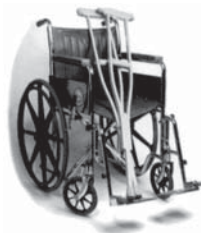
În cer nu va mai fi nevoie de cărje sau cărucioare.

F. Gelozia, teama, ura, falsitatea, invidia, necurăția, cinismul, corupția, îngrijorarea și toate relele nu vor mai exista în Împărăția lui Dumnezeu. Apocalipsa 21:8, 27: 22:15. Cei credincioși nu vor mai fi împovărați de grijile și neazurile care le făceau viața grea. Nu vor mai fi depresii nervoase. Timpul nu va avea sfârșit și apăsarea și plictiseala de pe acest pământ vor dispărea pentru totdeauna.